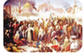
Kudüs ve Antakya gibi kutsal yerleri geri almak

Tabloda verilen nedenler ve ilgili oldukları alanlar aşağıdakilerden hangisinde doğru olarak eşleştirilmiştir?