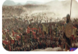
Türklerin Batı'ya olan ilerleyişini durdurmak