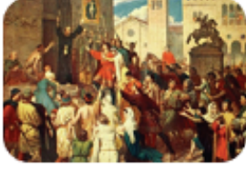
Doğu'nun zenginliklerini elde etmek